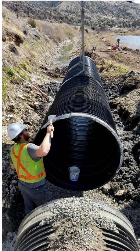
HDPE Polyethylene Pipe