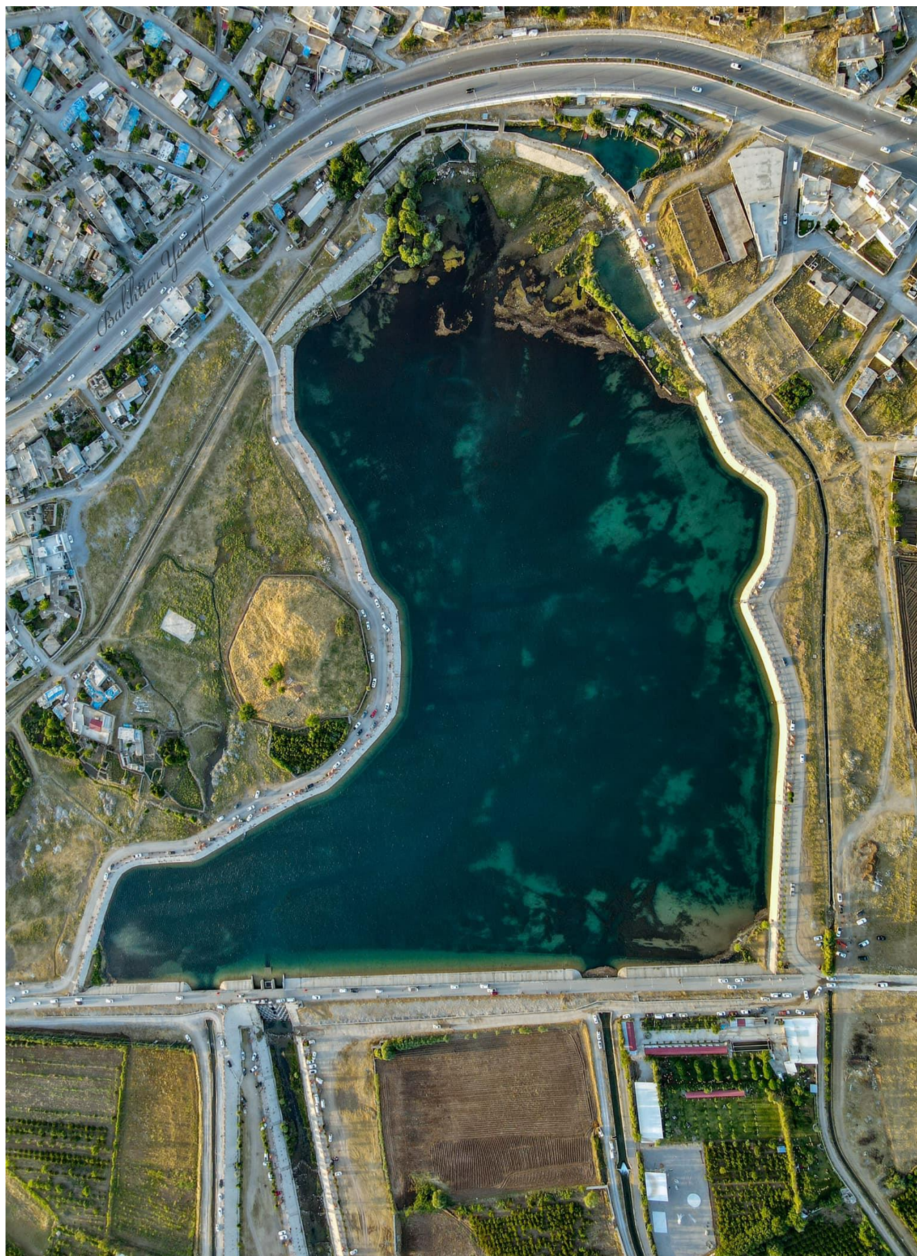
وینہی بہنداوی سہروچاوه